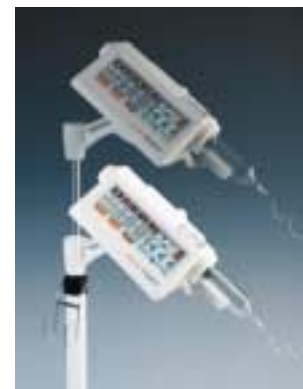
Pedestal de altura ajustable opcional