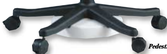
Pedestal de altura única