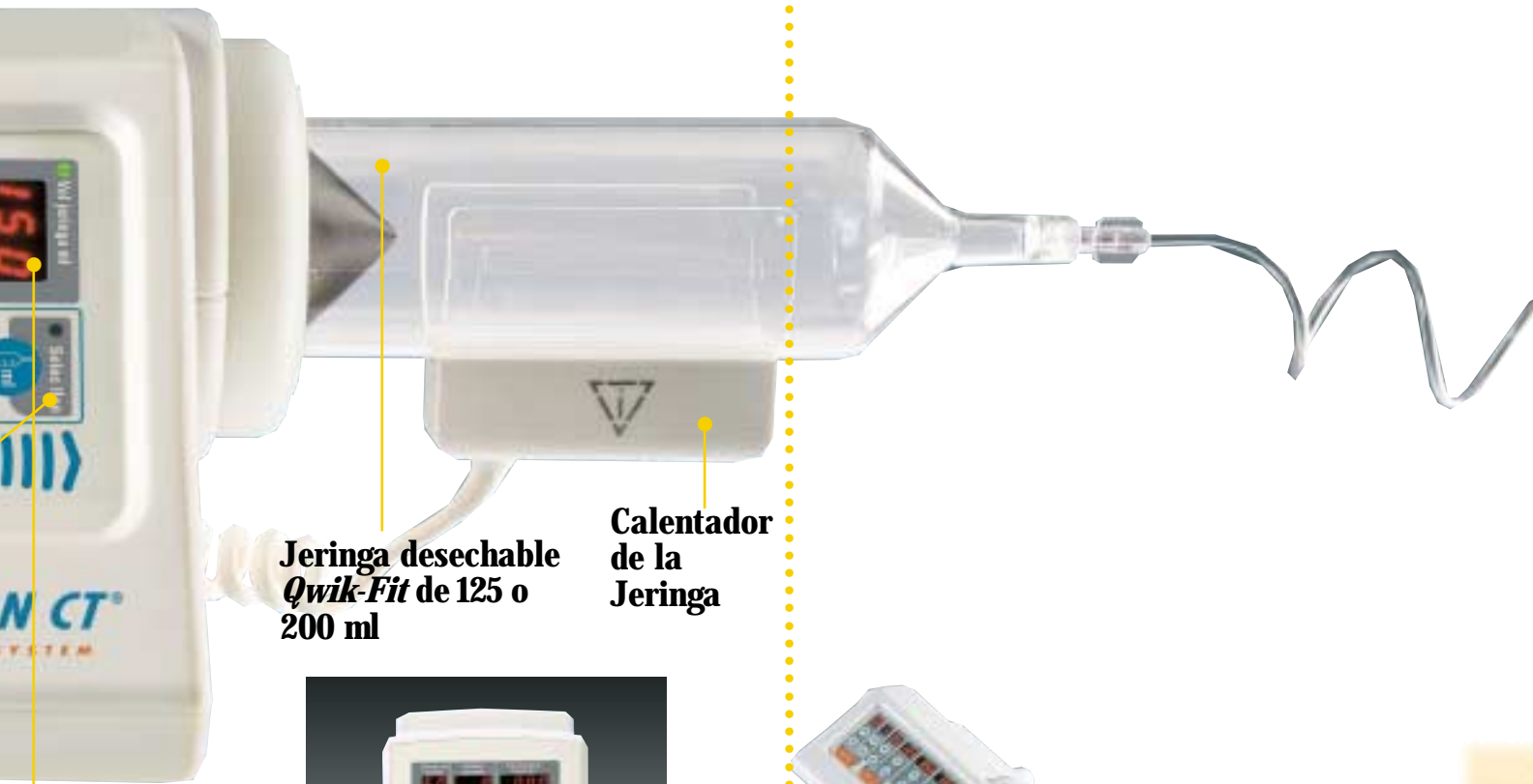
Jeringa/Volumen de auto llenado