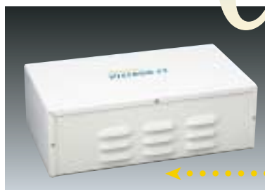
Consola del sistema de fuerza